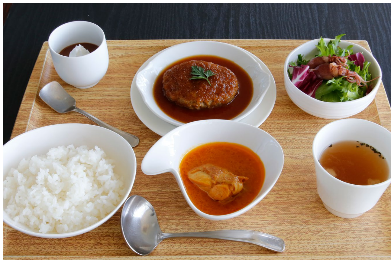
Recommended set 1,300yen Butter chicken curry / Rice / Hamburg steak with grated Japanese radish and ponzu sauce / Salad of boiled firefly squid / soup / mini dessert