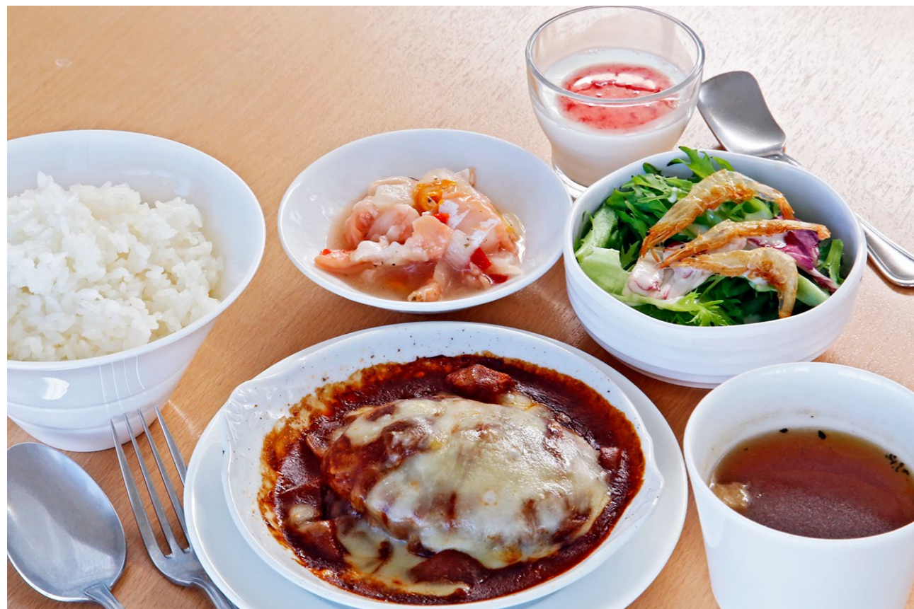
Recommended set 1,350yen Hamburg steak with cheese and demi-glace sauce / Marinated Salmon / Mini salad of white shrimp / Rice / Soup / Mini dessert